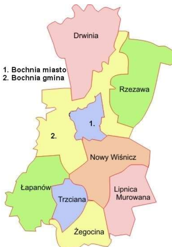
Mapa lokalizacji Gminy Lipnica Murowana w powiecie bocheńskim

Gmina w całości leży na obszarze Wiśnicko – Lipnickiego Parku Krajobrazowego. Potrzeba powołania Wiśnicko-Lipnickiego Parku Krajobrazowego podyktowana została wybitnymi - w skali ponadregionalnej – walorami kulturowymi, przyrodniczymi i krajobrazowymi.